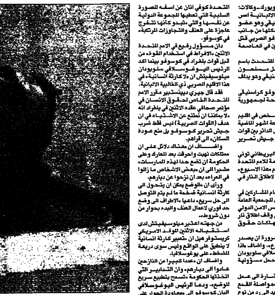
جثمان وزير دفاع كوسوفو، احمد كراستيفي سبجي في احد مستشفيات تيرانا عقب اغتياله (اس)